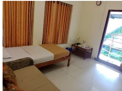
Single THUSHARA Type 2 (petite chambre, environ 12 m 2 , 1 lit simple, confort sommaire), plus récente, plus grande et plus lumineuse que les Single Thushara, située au 1 er étage ( en nombre très limité (3) )