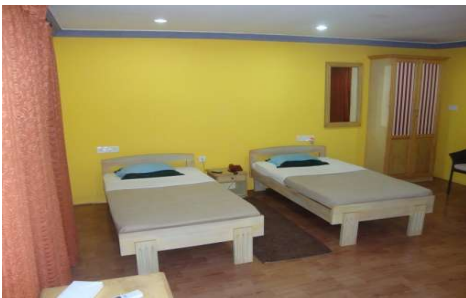
Twin Cottage (confort très sommaire, équipée de 2 lits simples, chambre située dans la palmeraie), en nombre très limité (2)

Nouveauté 2025 ! Les Roots room (équipées de 2 lits simples) sont des nouvelles chambres situées à proximité du bloc des Economy Rooms, elles sont plus petites que les Economy Rooms. Elles sont traversantes, entourées de nature et chacune dispose d'une terrasse. Parfaite pour une personne seule, à partager, il faut bien se connaître.