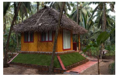
Bamboo Hut (2) situés dans la palmeraie