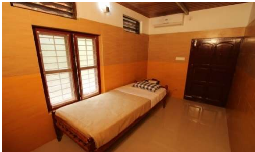
Single THUSHARA (très petite chambre, environ 9m 2 1 lit simple, confort très sommaire), en nombre très limité (4)