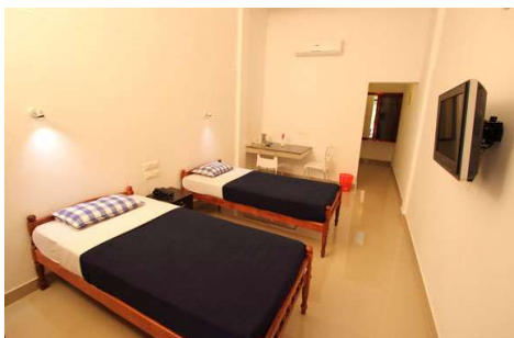
Economy room (14)