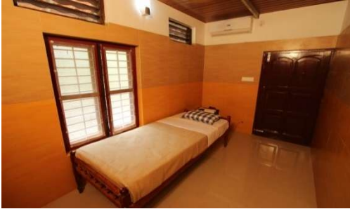
Single THUSHARA (très petite chambre, environ 9m 2 1 lit simple, confort très sommaire), en nombre très limité (2)